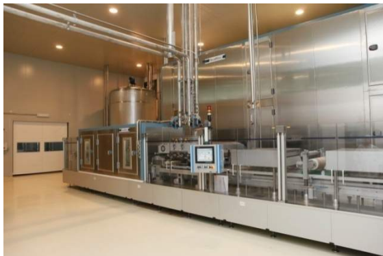
Шоколад и заменитель шоколада