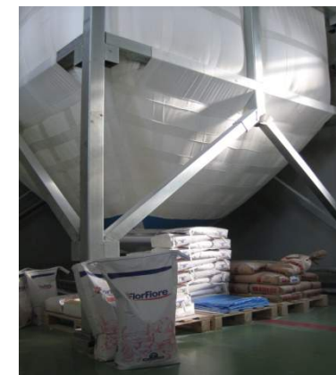
Смеси и улучшители